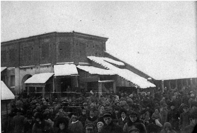
Рис.2. Ізяслав. Будинок на вул. Заславська, 33. (1928 або 1929 р).

молодшої гілки роду Острозьких, і пов'язане з цим становлення їх головної княжої резиденції, торкаються документи з архіву князів Сангушків, (зберігається у Кракові). Аналіз цих матеріалів дозволить скласти повніше уявлення про монументальну забудову міста у XVI–XVII ст., до складу якої входили