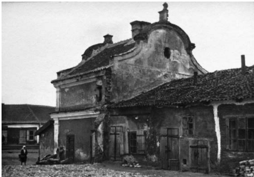
Рис. 7. Заслав. Ратуша. Фото 1926 р.

Повернемся знову до спогадів Павла Жолтовського: «Но вот проезжаем «цегельню», кладбище, въезжаем в «Старый город». Сначала у дороги мещанские усадьбы, мало чем отличающиеся от сельских хат, потом вас обступили местечковые дома, тесно скученные, без заборов, дворики. Деревянные каркасные, наполненные глиной, побелённые стены, черепичные крыши. Вот центральная площадь, замощенная глянцевым, истертым булыжником. В ярмарочные дни здесь тесно от возов, съехавшихся сюда окрестных селян.