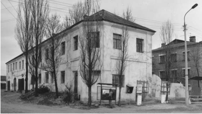
Рис.1. Ізяслав. Будинок на вул. Заславська, 33. (1983–1993 роки)