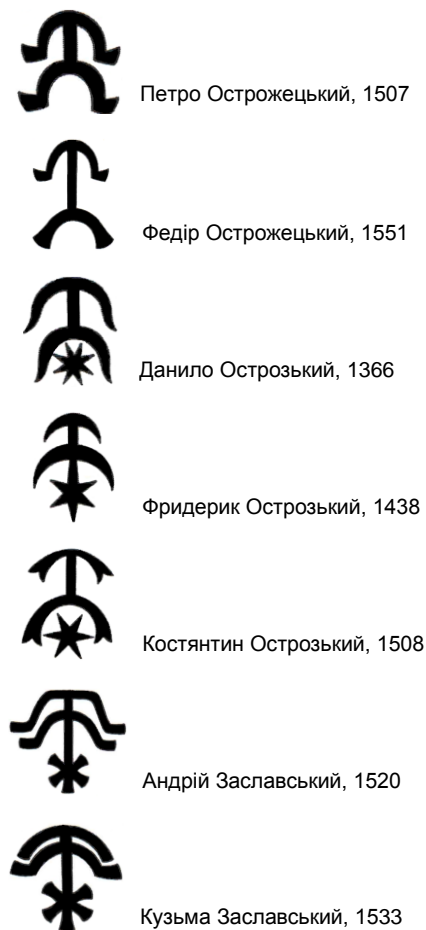
Рис. 4. Печатки князів Головнів-Острожецьких, Острозьких і Заславських

(Однороженко О. Руські королівські, господарські та князівські печатки... – С. 244, 262–263)