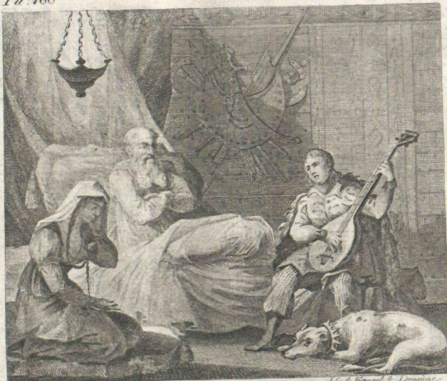
Laurea Błona del.