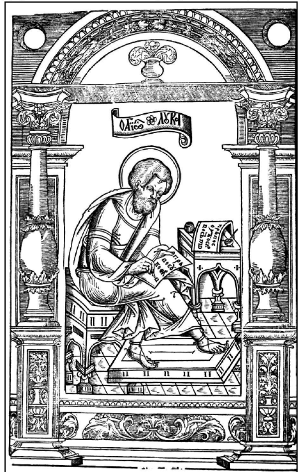
Св. Лука з львівського Апостола 1574 року – правдоподібно, портрет Івана Федоровича

запрошення князя В.-К. Острозького для заснування і здійснення книгодрукування прибув у його володіння, спочатку в село Дермань, де був призначений управителем Дерманського монастиря (1575-1576).