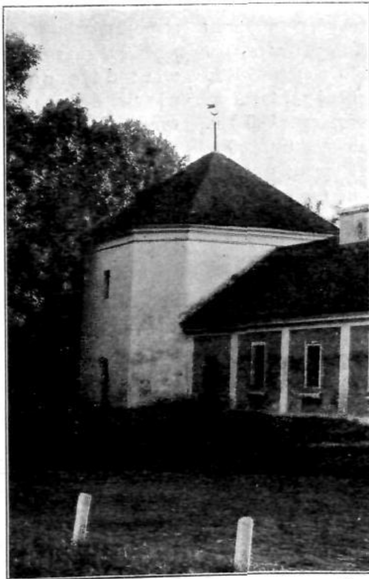
KAPLICA PRZY PAŁACU W TERESZKACH.

on następujący przykład: „Na wschodzie Peru, w tem miejscu gdzie Amazonka ścieka do niziny, rozpoczęto przemywać złoto; dobry zarobek sprowadził dużo tak zwanych Aymarów z wyżyn peruwiańskich do niziny. Ulegli oni jednak natychmiast wpływowi klimatu: powietrze niziny było dla nich zbyt gęste. Tylko bardzo nieliczne rodziny Aymarów mogły się utrzymać przy życiu, reszta wyginęła. Gdy drugie ich pokolenie pracowało w przemywalniach złota, odwiedził te przedsiębiorstwa lekarz angielski Forbes. I cóż zauważył? Otóż stwierdził znaczne zwężenie klatki piersiowej u Ai-