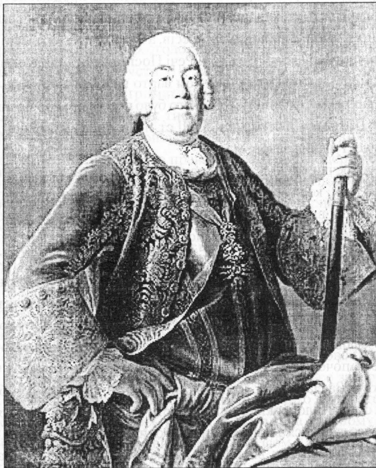
Польський король Август III