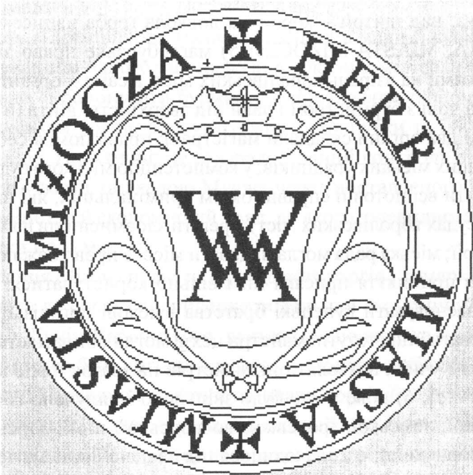
Герб Мізоча, наданий в 1761 р.