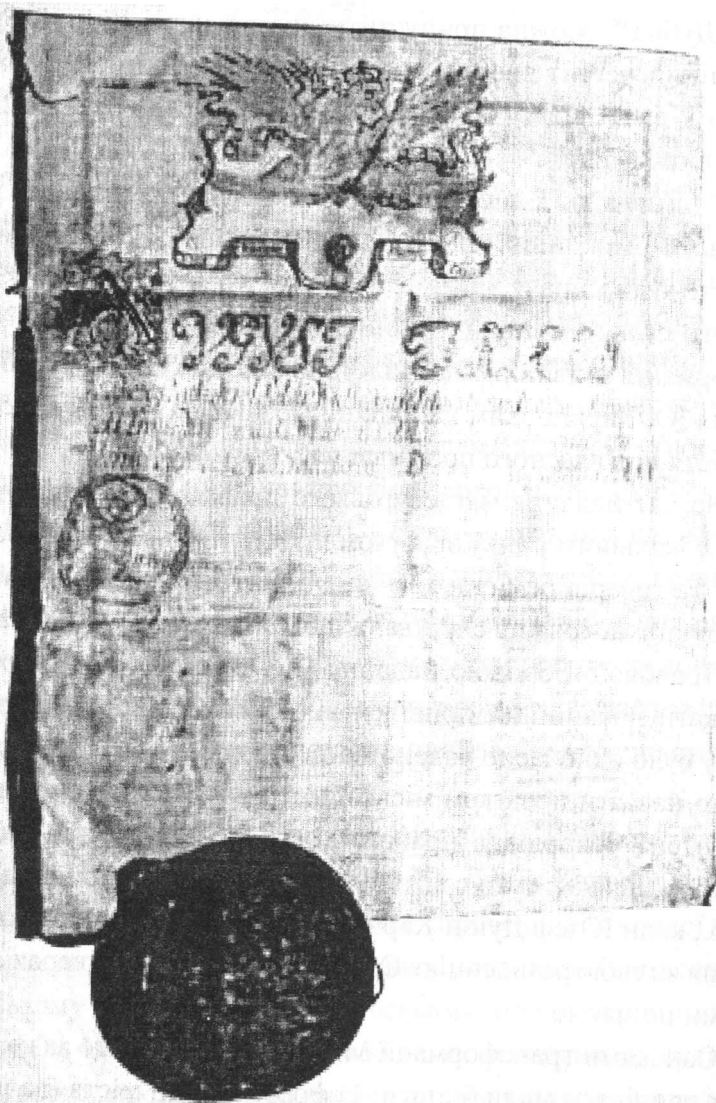
Локаційний привілей для Мізоча від 23 вересня 1761 р.